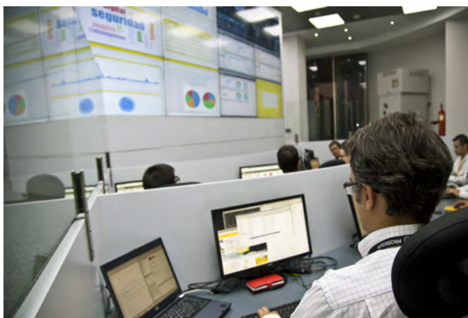
Security Office Center (SOC) de Prosegur para servicios de ciberseguridad

Conforme a la Ley 5/2014, de 4 de abril de Seguridad Privada que insta a sus profesionales a acreditar una formación específica y adaptada al sector para el que desarrollan su actividad, surge el “Programa de Acreditaciones de formación especializada” una de las últimas acciones pioneras puesta en marcha por Prosegur.