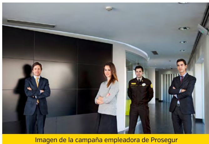
Imagen de la campaña empleadora de Prosegur

La fuerte dispersión geográfica de Prosegur en España, dificultaba la vinculación de ciertos colectivos con la compañía. De este modo, disponer de toda la información de los empleados en un único sistema, resultaba una cuestión prioritaria a la hora de gestionar el talento y de diseñar procesos de recursos humanos alineados con los objetivos estratégicos de la compañía: formación, planes de movilidad interna, y comunicación, entre otros aspectos.